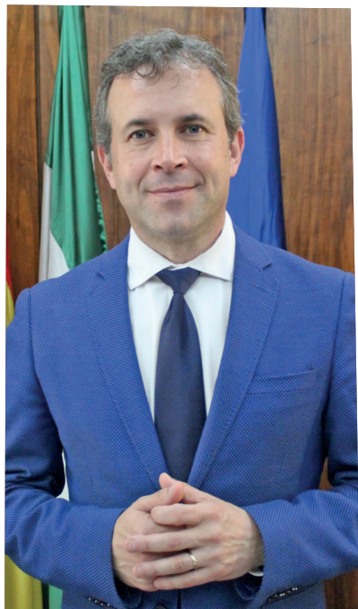
JULIO MILLÁN MUÑOZ Alcalde de Jaén